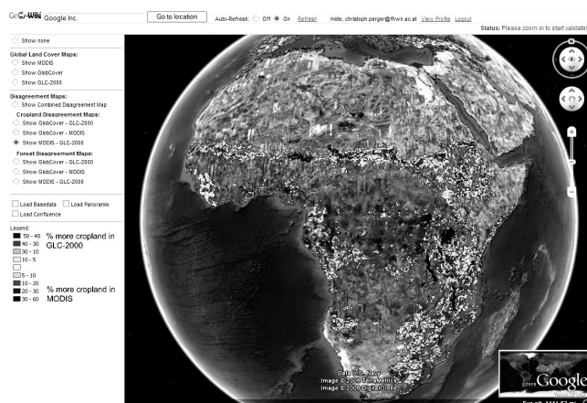
Abb. 1: Hauptseite mit Google Earth Plug-in und aktivierter Disagreement Map

Nach erfolgter Anmeldung wird der Benutzer zur Hauptseite (Abb. 1) weitergeleitet.