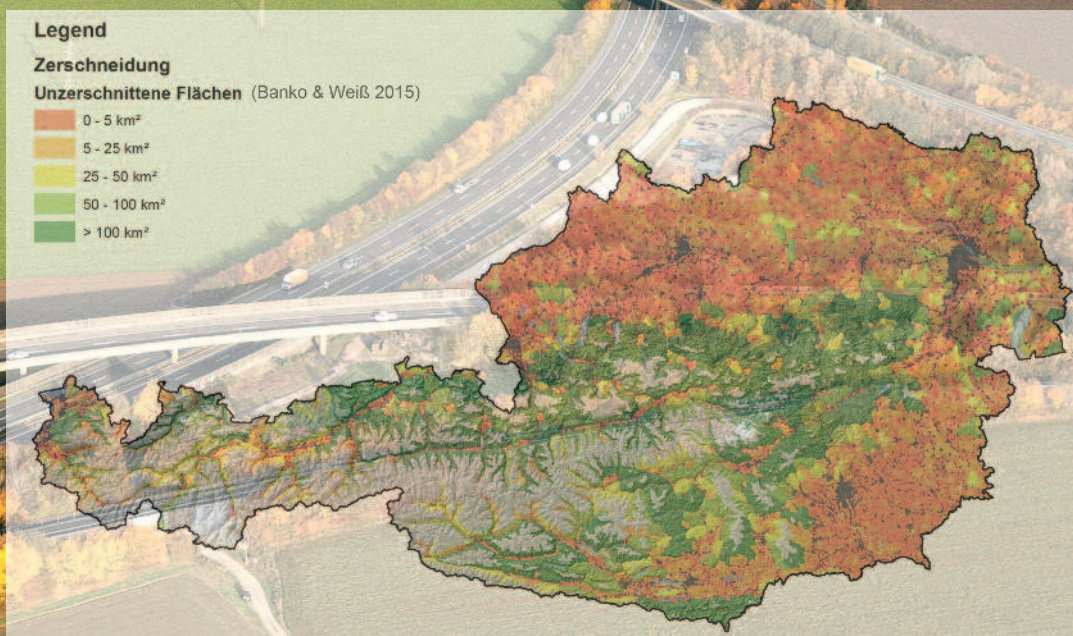
Abb. 2: Fragmentierungsgrad in Österreich, durchschnittliche effektive Maschenweite pro km 2

nahmen wie das Absiedeln ganzer landwirtschaftlicher Betriebe bis hin zu Enteignungen erreichbar (vgl. GEBBINK 2009).